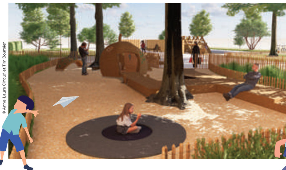
© Anne-Laure Giroud et Tim Boursier

Renseignement auprès des Centres sociaux et Culturels Arc-en-Ciel: 04 78 70 42 95