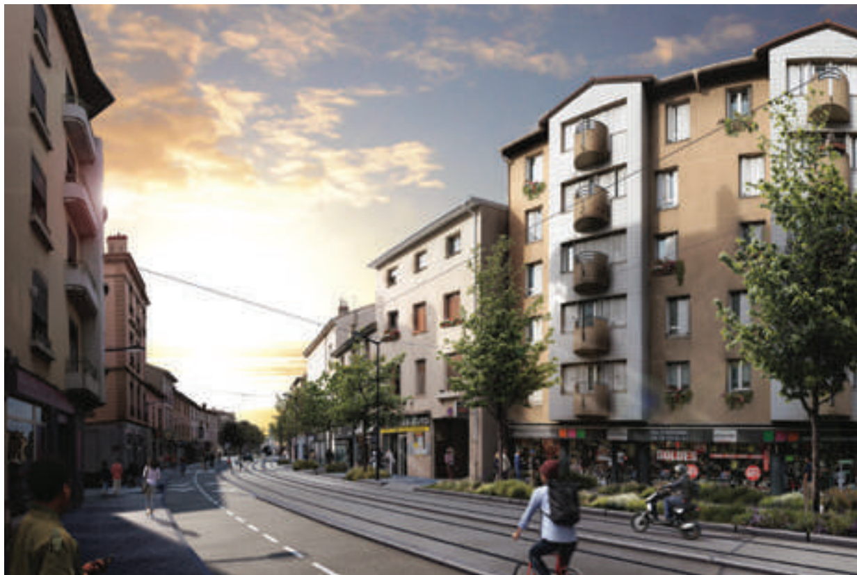
ILEX © Antoine Derrien