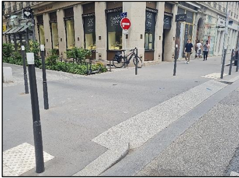
Rue Simon Maupin, Lyon 2ème