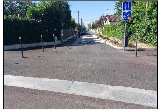
Rue Thénard, Lyon 8ème