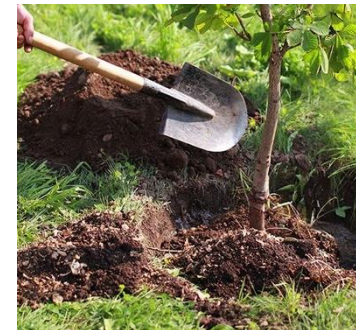
Sélection des plantes en pépinière et chantier de plantation