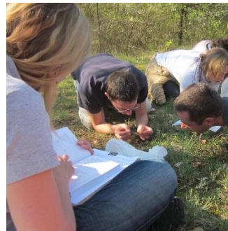
Diagnostic des espaces extérieurs et de la qualité des sols