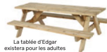
La table d'Edgar existera pour les adultes et pour les enfants

La table d'Edgar : Cette grande table intégrant des plateaux de jeux (échecs, ardoises, petit bac, circuit pour enfants, etc.) vise à permettre l'échange et le partage.